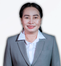
นางจිරองรณ องศ์เสีอง กรรมการ กลุ่ม 11